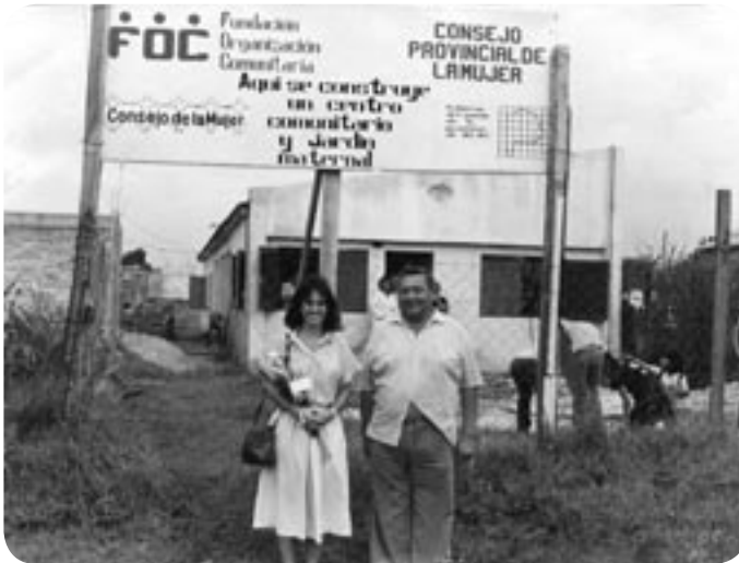
■ Construcción de uno de los Jardines de la Red de FOC

Jardines Maternales, Red de Jóvenes Unidos la Red de Organizaciones del Conurbano Sur, entre otras) lograron avanzar en el diseño y ejecución de estrategias de posicionamiento público y establecer alianzas con organismos del Estado y con fundaciones empresarias y empresas, fortaleciendo aspectos institucionales, mejorando sus capacidades de gestión y la calidad de los servicios que brindan a la comunidad.