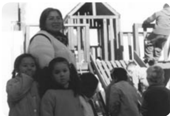
■ Jardín Maternal Comunitario de la Red de la Fundación de Organización Comunitaria

La Red es un espacio asociativo compuesto por siete centros de desarrollo integral, situados en distintos barrios periféricos del partido de Lomas de Zamora 1 a los que diariamente concurren más de 1.500 nenes y nenas desde los 45 días de vida hasta los doce años. La oferta social y educativa de los centros excede lo puramente pedagógico (sala maternal, salas