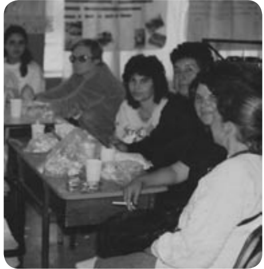
Encuentro de ■ capacitación de madres educadoras

capital de vínculos y articulaciones establecidas con otros actores sociales.