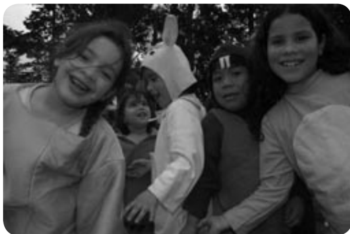
■ Jornada recreativa de la Red de Jardines Maternales Comunitarios FOC

Las estrategias de protección y promoción del desarrollo infantil que se realizan desde la Red y que permiten promover un trabajo comunitario buscan: