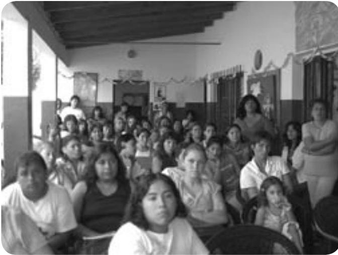
■ Encuentro de capacitación de madres educadoras

Las madres educadoras encuentran en estos espacios la posibilidad de verse fortalecidas en su doble rol de madres y líderes comunitarias, apropiándose de recursos simbólicos que las sostienen y fortalecen en el marco de los distintos contextos sociales (hasta los de profunda crisis) que atravesó el país en los últimos 15 años.