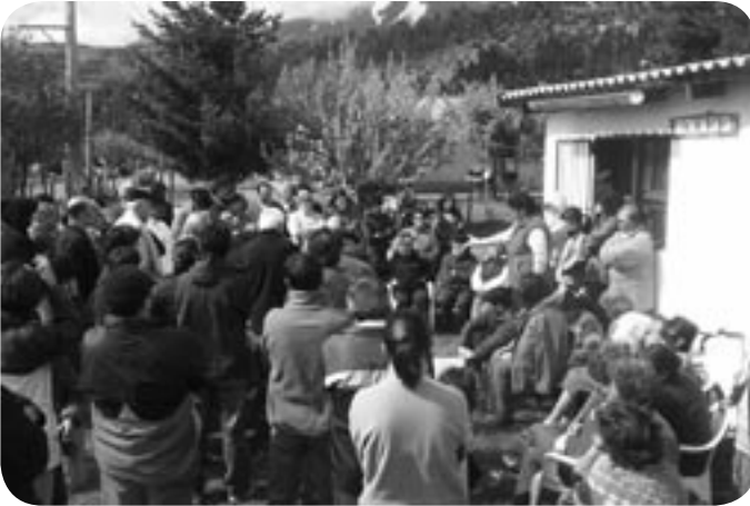
▲ Las reuniones antes de la sala