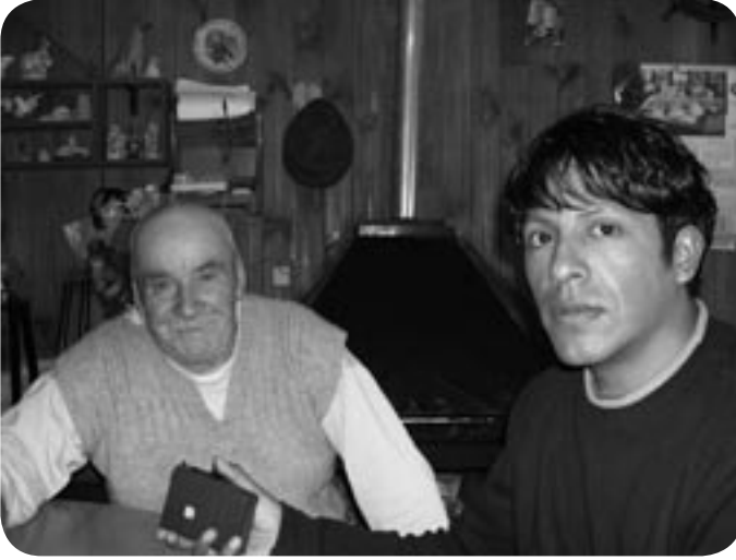
▲ Uno de los vecinos entrevistados