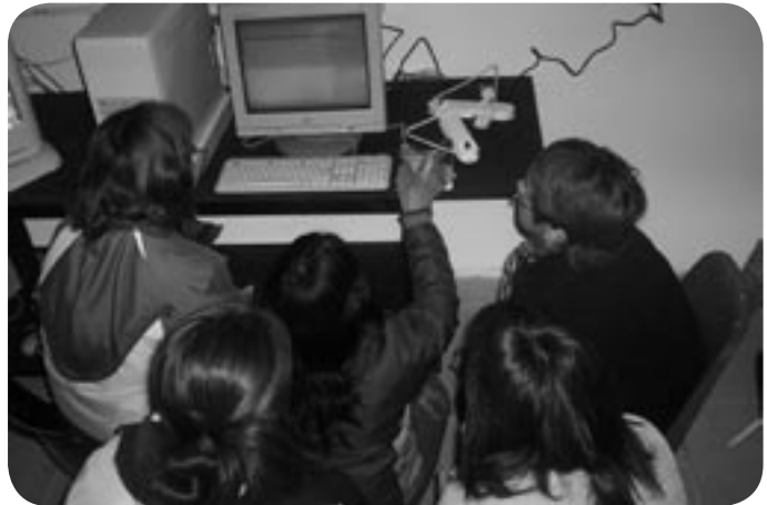
Imágenes de ▲ clases

Hoy en día son las capacitadoras del espacio que edificamos en el barrio. Asimismo ellas y otros vecinos se están capacitando en arreglo de hardware y armado de redes, a fin de contar con suficiente autonomía de conocimiento como para sostener este espacio.