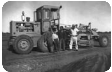
▲ La foto “antes” y “después”

En este proceso las jóvenes que se acercaron han desarrollado capacidades para el manejo del Photoshop , Frontpage , entre otros programas, donde se destaca el diseño de páginas web para difundir la información del barrio y de los sectores populares en general, y digitalización y edición de voces de vecinos. Estas capacidades serán fundamentales para la creación del archivo barrial de imágenes, voces y documentos del barrio. Estas jóvenes, además, han sido acompañadas en la gestión para un proyecto personal de enseñanza de folklore en el barrio, que llevaban ade-