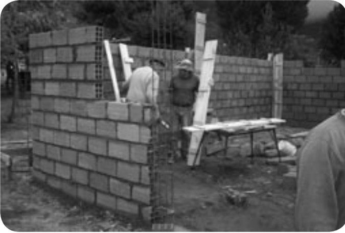
▲ La edificación