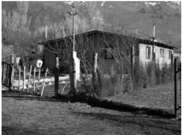
Imagen de una de las ▲ casas del barrio

El espacio concreto sobre el que aplicamos la experiencia de armar un archivo de voces y crear las condiciones para la apropiación social del mismo fue el barrio Pilar I, que dentro de los “barrios del alto”, constituye un caso singular de organización autónoma, independiente y democrática.