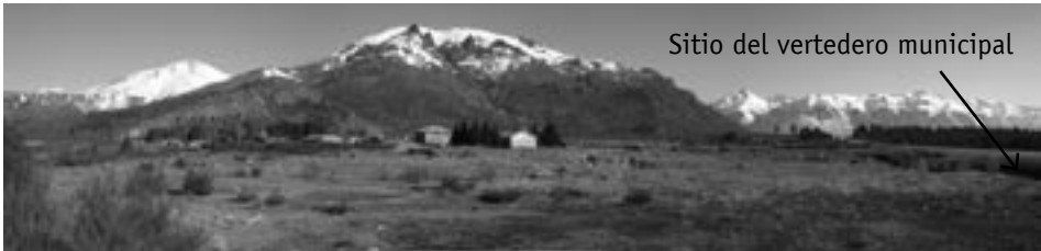
Sitio del vertedero municipal

Nacido en 1972 como campamento de obreros viales, al terminar la empresa de construcción responsable el pavimentado de la ruta provincial 258, las familias compraron los predios y se radicaron definitivamente en el lugar. Esta compra se realizó bajo ciertas condiciones de irregularidad que trabaron la obtención de los títulos de propiedad. Entre las iniciativas que muestran la falta de reconocimiento de estos vecinos por parte del gobierno municipal se cuenta el asentamiento de un basurero a cielo abierto en el terreno inmediatamente aledaño al barrio, efectivizada en el año 1978.